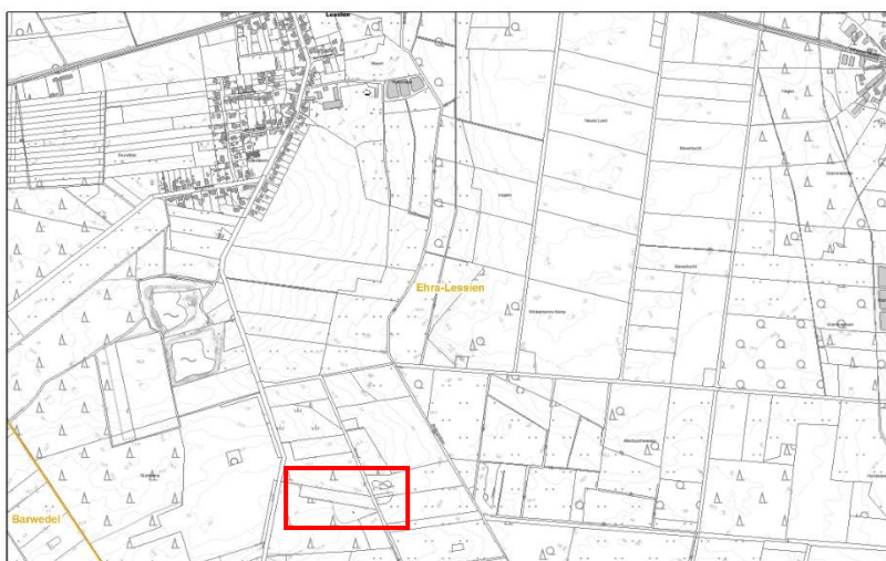
Abb. 2: Lage der Ersatzaufforstung in der Gemarkung Ehra-Lessin (Quelle: LGLN 2025).

Für den vollwertigen Ausgleich der WU ist auf einer Fläche von mindestens 3.595 m 2 ein KÄ von mindestens 5.033 m 2 zu leisten. Weist die EA / WNB einen geringeren Wert als die WU auf, so ist die EA auf bis zu 150 % der WU zu erweitern. Ein ggf. weiterer waldrechtlicher Ausgleich ist durch WvM herbeizuführen.