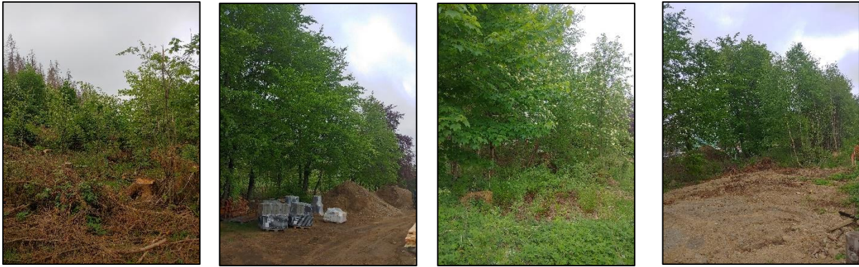
Abb. 1: Fläche der Waldumwandlung im Frühsommer 2022.

Mit Blick auf die Bewertung prognostiziert die Tab. 5 den Waldzustand der Hauptbaumarten Rot-Buche und Fichte, deren forstliche Umtriebszeiten vor Ort bei 160 Jahren (Buche) bzw. 120 Jahre (Fichte) zur HUZ im Alter von 80 Jahren bzw. 60 Jahren zum mittleren Stichtag 01.07.2064.