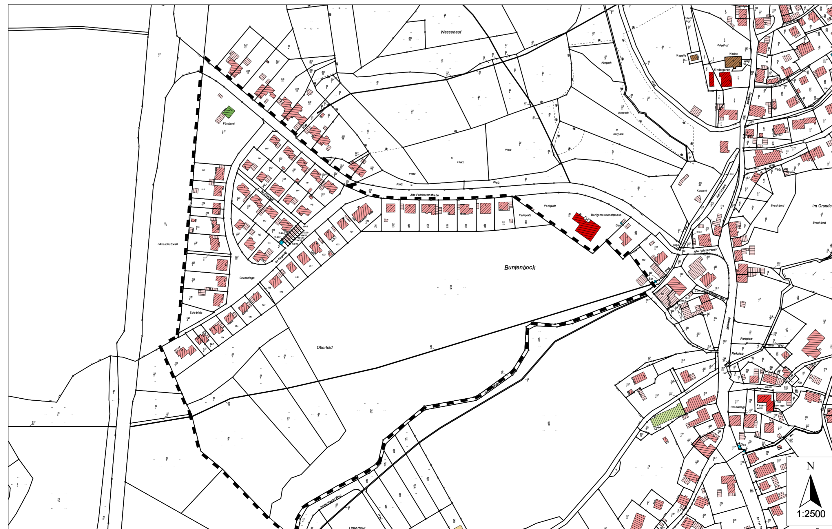
Neuer Geltungsbereich des Bebauungsplanes Nr. 3 "Oberfeld"