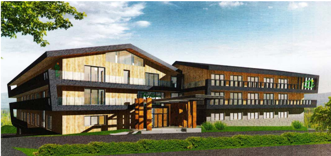
Abbildung 1: Vorderansicht Hotel Eingangsbereich von der Bundesstraße 4 aus

Der geplante Hotelkomplex ersetzt die vorhandene Hotelbebauung zwischen Bundesstraße 4 und Grenze zum Nationalpark Harz durch einen mehrgeschossigen Hotelkomplex aus drei massigen, aneinandergrenzenden Gebäuden, welche auf ein ausgedehntes Basisgeschoss aufsatteln. Im Zentrum des Komplexes nach Osten hin ist eine Lücke, in welcher der massive Baukörper etwas aufgelöst wird. Zudem läuft das Basisgeschoss in eingeschossiger Bauweise zur Nationalparkseite hin aus. Vorhandene Dachflächen im unteren Bereich werden überwiegend mit Dachbegrünung versehen.