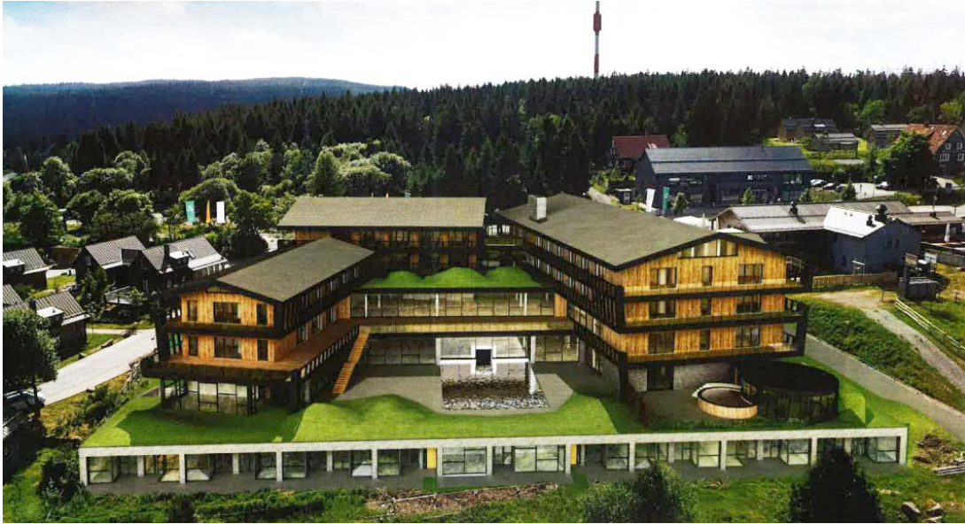
Abbildung 2: Rückansicht von Osten, Nationalparkseite

Eine Be- und Eingrünung des Gebäudes ist nicht vorgesehen und aufgrund der Größe des Gebäudes auch nicht wirkungsvoll umsetzbar. Unmittelbar östlich an das Plangebiet angrenzend erstrecken sich Bergwiesenflächen mit eingestreuten Fichten sowie geschlossene Fichtenfor-