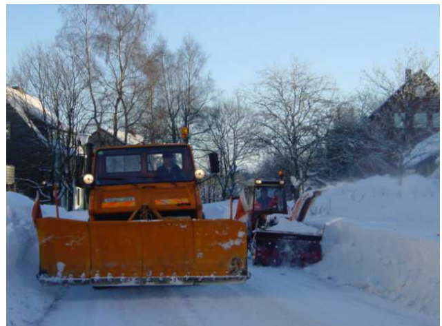
Na bitte, geht doch...

Wenn alle Beteiligten Verständnis füreinander entwickeln, lässt sich jede Situation meistern!