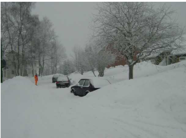
Wenn die eingeschneiten Fahrzeuge nicht hier stünden, könnte der Baubetriebshof arbeiten